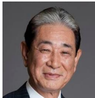
故 星野仙一 大会永世名誉会長

「野球を通じて、勝つ喜び、負けた悔しさを味わうことも大切だ。楽しくケガをせずプレーするのはもちろんだけど、時には勝負にこだわろう」 (2017年5月チームに向けた読売KODOMO新聞でのメッセージ)